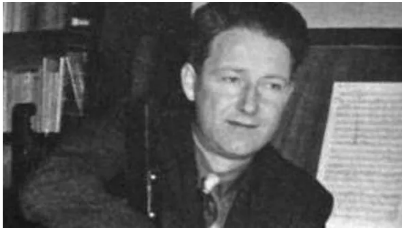
Il compositore Lavagnino

06 Novembre 2024 alle 12:08 1 minuti di lettura