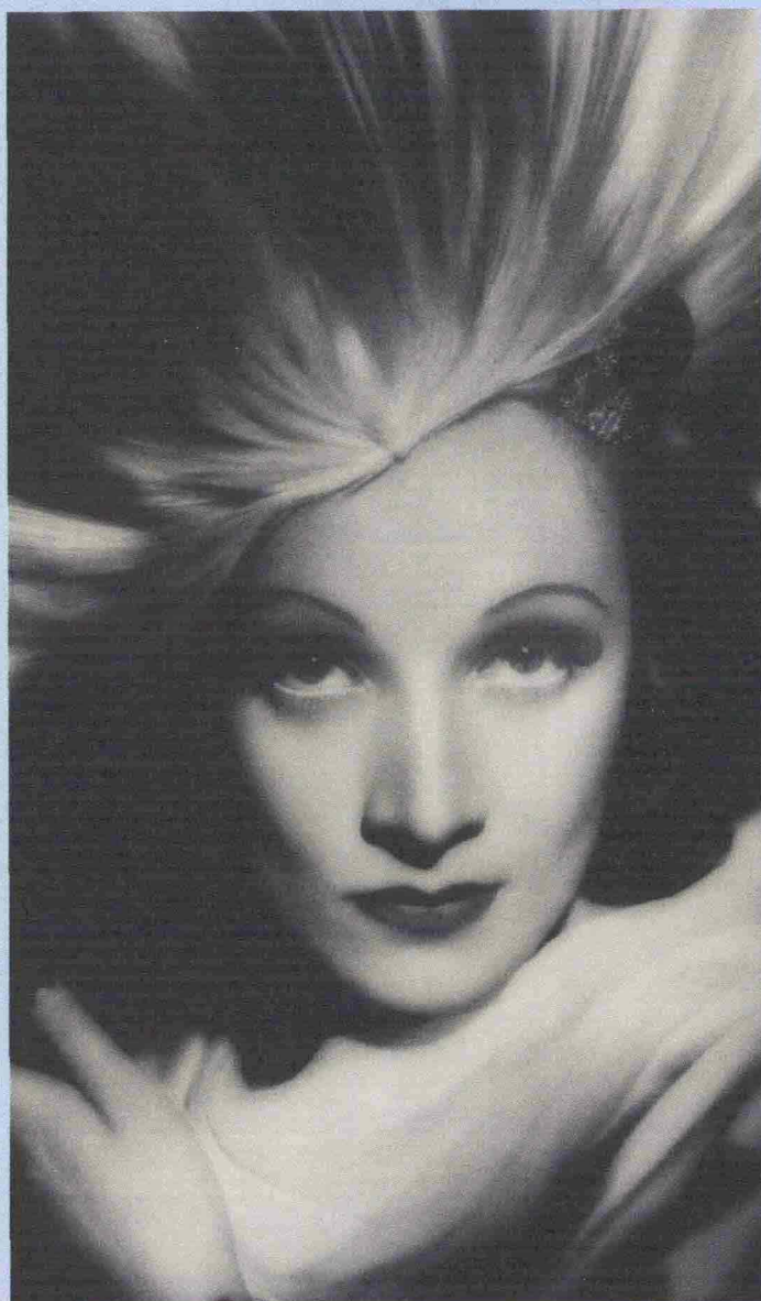
Marlene Dietrich in "Shanghai Express"

Il fascino indiscreto di Shanghai, la più "occidentale" delle città cinesi, già definita "la Parigi d'Oriente" o "la prostituta d'Asia", visitata dalle moltitudini per l'Expo 2010, ma già nei sogni del mondo all'inizio del Novecento, ancora adesso una delle più vivaci metropoli della Cina: la celebra una rassegna intitolata "Maratona Shanghai" e organizzata mercoledì 12 da Docucity e Istituto Confucio con quattro film in cui è protagonista. In sequenza, dalle 13.30, Shanghai Express , strepitoso bianco e nero con una conturbante Marlene Dietrich (1932), alle 15 Shanghai Triad del premiatissimo Zhang Yimou (1995) con la bella Gong Li, alle 17 il celeberrimo Cina di Michelangelo Antonioni (1972) e alle 18 il più recente Suzhou River di Lou Ye (2000). All'Università degli Studi, piazza Montanelli, Sesto San Giovanni, ingresso libero, informazioni 0250621675. (m.t.)