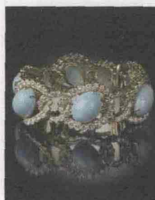
Bracciale Van Cleef

Dipinti antichi e moderni (con tanto Novecento italiano, da Boetti a Sironi), sculture inedite, argenti e gioielli, manufatti e tessuti e arredi, arte orientale ed etnica. Circa 2.000 pezzi in mostra e in vendita al Palazzo della Permanente (via Turati 34) dal 12 al 17 aprile per "Collezioni d'Arte", appuntamento per