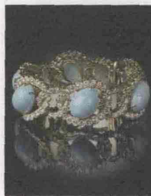
Bracciale Van Cleef

Dipinti antichi e moderni (con tanto Novecento italiano, da Boetti a Sironi), sculture inedite, argenti e gioielli, manufatti e tessuti e arredi, arte orientale ed etnica. Circa 2.000 pezzi in mostra e in vendita al Palazzo della Permanente (via Turati 34) dal 12 al 17 aprile per "Collezioni d'Arte", appuntamento per