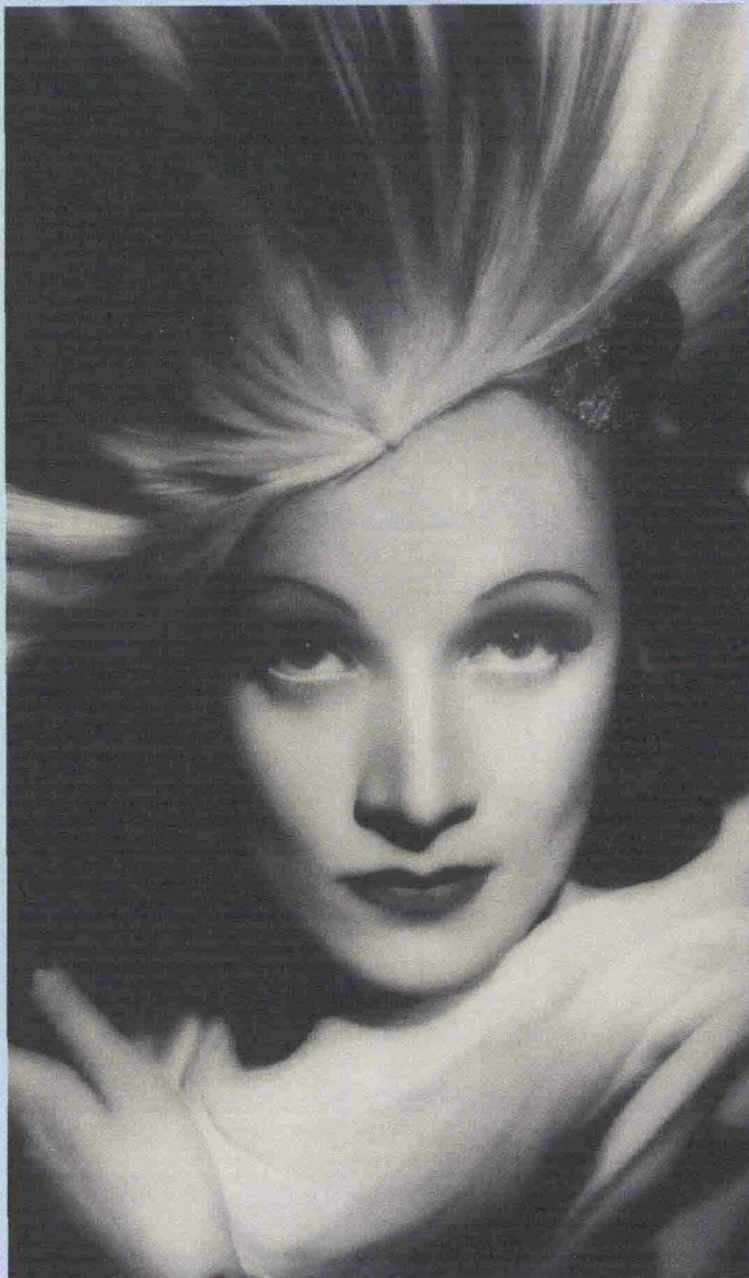
Marlene Dietrich in "Shanghai Express"

Il fascino indiscreto di Shanghai, la più "occidentale" delle città cinesi, già definita "la Parigi d'Oriente" o "la prostituta d'Asia", visitata dalle moltitudini per l'Expo 2010, ma già nei sogni del mondo all'inizio del Novecento, ancora adesso una delle più vivaci metropoli della Cina: la celebra una rassegna intitolata "Maratona Shanghai" e organizzata mercoledì 12 da Docucity e Istituto Confucio con quattro film in cui è protagonista. In sequenza, dalle 13.30, Shanghai Express , strepitoso bianco e nero con una conturbante Marlene Dietrich (1932), alle 15 Shanghai Triad del premiatissimo Zhang Yimou (1995) con la bella Gong Li, alle 17 il celeberrimo Cina di Michelangelo Antonioni (1972) e alle 18 il più recente Suzhou River di Lou Ye (2000). All'Università degli Studi, piazza Montanelli, Sesto San Giovanni, ingresso libero, informazioni 0250621675. (m.t.)